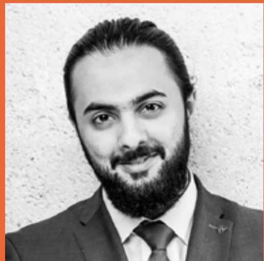
Hunain Account Manager

Bereits während meines Studiums war ich als Leadmanager für die COMLINE aktiv. Anfang 2020 hat sich für mich die Möglichkeit ergeben, durch ein Traineeprogramm im Bereich Sales durchzustarten. Das Traineeprogramm ermöglichte mir einen angenehmen Einstieg in die komplexe IT-Welt. Als Account Manager im Bereich Neukundengewinnung der COMLINE begleite ich unsere Kunden bei ihren individuellen Herausforderungen im Bereich der IT, Cloud und Digitalisierung.