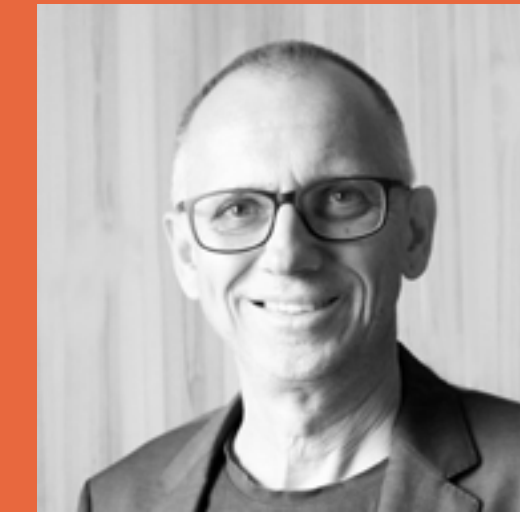
Maik Service Manager

An erster Stelle steht für uns herauszufinden, wie wir menschlich zueinander passen. Eine offene und ehrliche Gesprächsführung, die du auch von uns erwarten kannst, ist uns dabei besonders wichtig. Wenn sich dein zukünftiger Arbeitsplatz direkt bei einem unserer Kunden befindet, vereinbaren wir bei Bedarf auch einen „Schnuppertag“, damit du diesen und dein Team kennenlernen kannst. Hier bist du mittendrin in der zukünftigen Aufgabe, kannst dir ein Bild vom Arbeitsumfeld machen und erhältst eine reale Vorstellung deiner zukünftigen Tätigkeit.